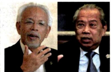
Muhyiddin (kanan) dalam sidang mediannya pada Jumaat naik berang selepas dicabar oleh Shahrir untuk menarik sokongan terhadap kerajaan negeri Johor.

Tambah beliau, situasi pergolakan politik yang berlaku di Melaka, Sabah dan kerajaan Pusat ketika ini sebenarnya kesan persaingan pemusatan kuasa dan