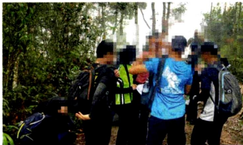
Sebahagian pendaki yang ditahan di HSK Semangko pada Sabtu.

HULU SELANGOR - Jabatan Perhutanan Negeri Selangor (JPNS) menahan seramai 50 individu kerana melakukan aktiviti pendakian tanpa permit sah di Hutan Simpanan Kekal (HSK) Semangko di sini pada Sabtu.