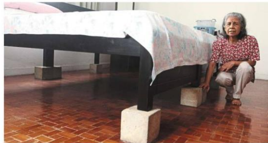
Ambikai showing the large bricks that are used to raise the bed in the master bedroom to protect it from floodwaters.