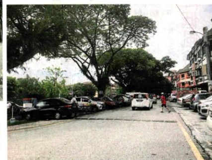
■在商業中心擺攤的小販平日不多，周六周日比較多。

前新早市的土地轉換手續在進行中，只要完成土地轉換，舊早市小販便再無不搬的理由。房政部已同意土地轉換申請，目前等內政部的支持。