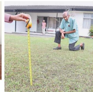
Naysarajah says water level can reach 0.3m high each time there is a flash flood.

"For more than two decades now MPK has not resolved the matter.