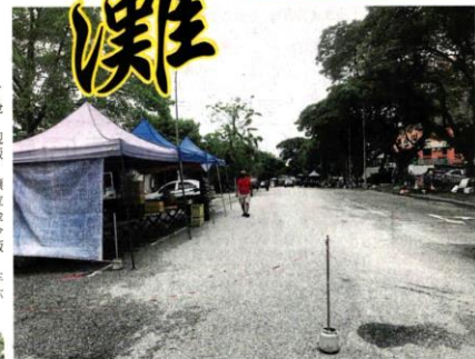
■舊早市部分小販堅持不搬到新早市，至今還在路邊擺攤。