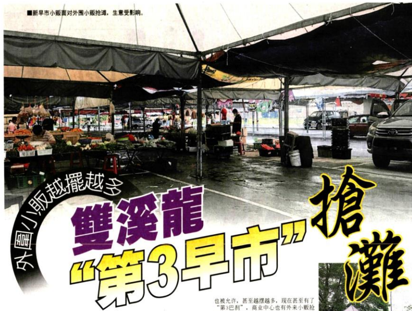
■新早市小販面對外圍小販搶灘，生意受影響。